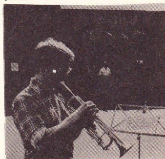
Medlem i VPK-Lunds och VPK - Malmös förenade blåsorkestrar övar i vårsolen utanför festlokalen