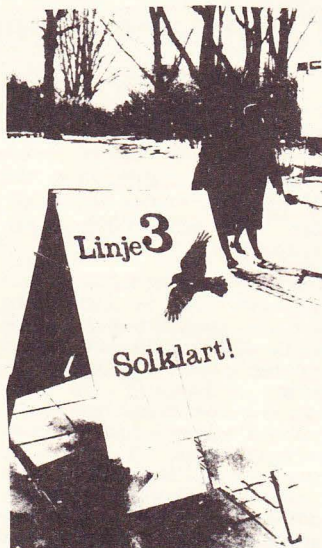
Än lever de gamla parollerna!

Slutligen kräver VPK i motionen att kommunen skall uppmana