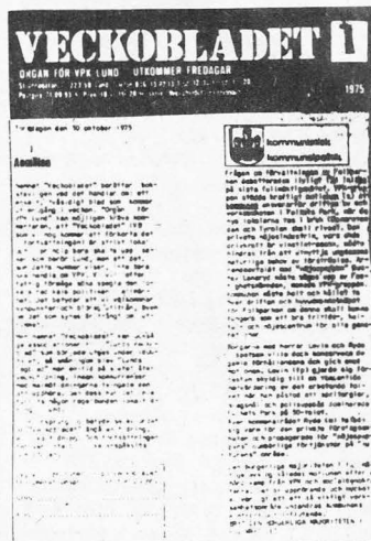
VB nr 1 årgång 1

Denna amatörism ser vi som ett värde som måste bevaras, även om VB i framtiden utvecklas vidare. Det framtidsmål som VB-utredningen menade att man kan sträva efter i ett »medellångt perspektiv» är att tidningen blir 8-sidig. Men en sådan utvidgning fungerar inte inom de nuvarande ramarna, utan den förutsätter att någon deltidanställs. Den förutsätter också en större upplaga och en stabilare ekonomi.