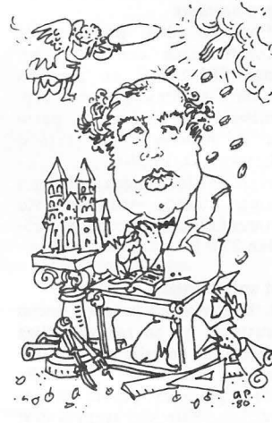
UTBILDNINGSMINISTERN I LUND

Någon i publiken undrade om Wikström kunde ge något exempel på liberal politik från hans sida. Men han blev svaret skyldig, dock menade han att det varit mycket värre om en moderat eller centerpartist varit utbildningsminister. Och det är ju möjligt.