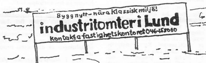
Den föreslagna skylten. Textförfattaren okänd.