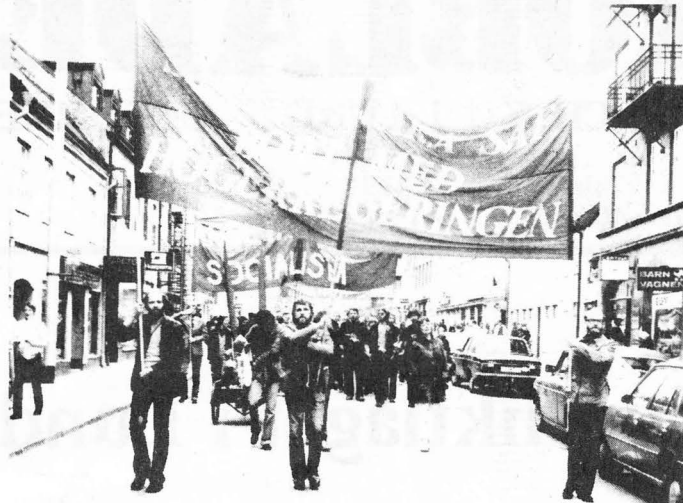
Nedan ger en av demonstrationsledningens medlemmar sin syn på årets första maj-demonstration i Lund.

1980 års upplaga av demonstrationen Arbetarpolitik och socialism i Lund hade i första hand inte att kämpa emot vädermakternas blåst utan mot de starka högerindarna som borgarregeringen och SAF frammanat. Det faktum att Sverige stod inför den största arbetsmarknadskonflikten någonsin kom givetvis att präglade demonstrationen. Ända fram till samlingen på Clemenstorget bedrevs en febril aktivitet med att trycka dagsaktuella flygblad om avtalsläget, uppfinna nya slagord (15 öre hit - 30 öre dit - stoppa kapitalets profit och 1909 - 1980 samma fiende, samma kamp) och tillverka banderoller som knöt an till situationen på arbetsmarknaden.