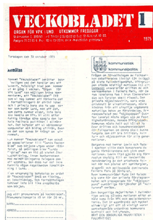
Veckbladets allra första nummer 30 oktober 1975