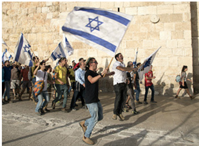
Bosättare utanför Jerusalems gamla stad

Praktiskt taget hela världen fördömer Rysslands olagliga annektering av de östra delarna av Ukraina. Det ena sanktionspaketet efter det andra införs för att sätta press på Ryssland. Det militära och ekonomiska stödet till Ukraina ökar. Allt i syfte att driva tillbaka Ryssland och få angriparen att respektera internationell rätt. Ett sådant samfällt och beslutsamt handlingsätt är bra och nödvändigt och viktigt att tillämpa även mot en stormakt som Ryssland.