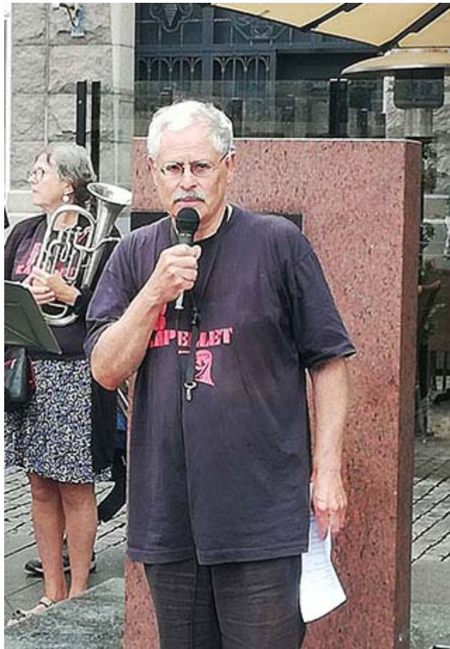
Owe Svensson sjunger "Jimmies visa"