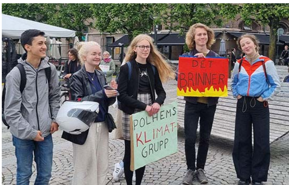
I demonstrationen deltog Polhemsskolans klimatgrupp