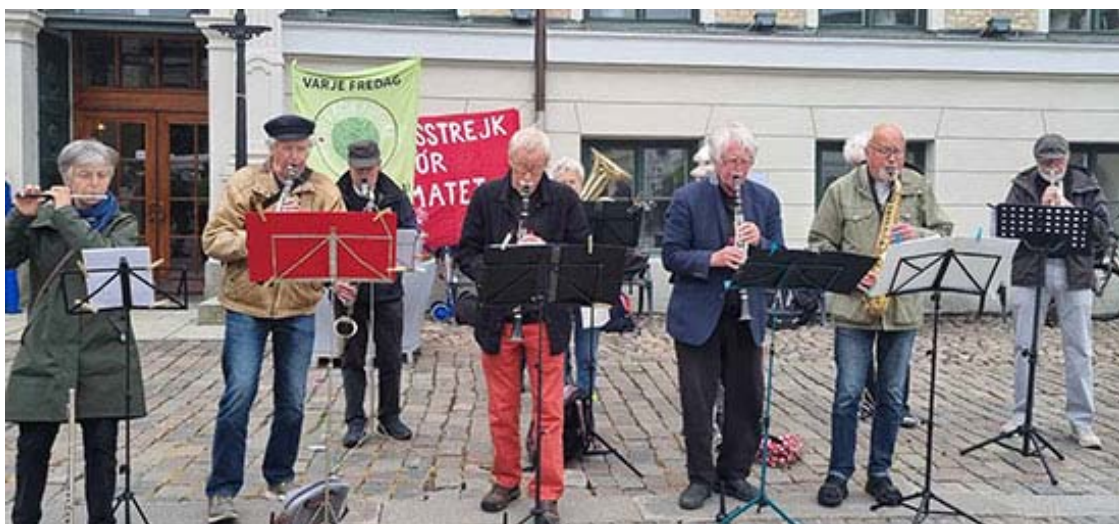
Uthållighetens orkester, Röda kapellet, spelade mellan talen