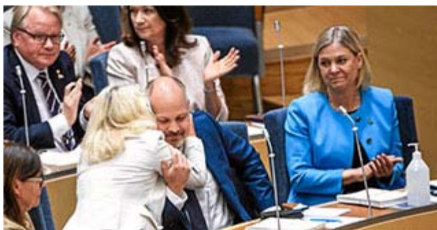
Morgan Johansson får sitta kvar.

Vi kämpar på i riksdagen med att få klart alla de ärenden, debatter och voteringar som är kvar innan sommaren - och innan den här mandatperioden tar slut.