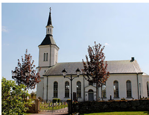
Vederslövs nya kyrka