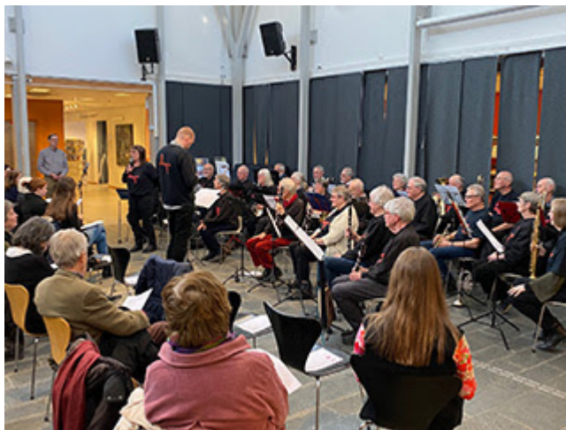
Röda Kapellet på Stadsbiblioteket den 8 mars