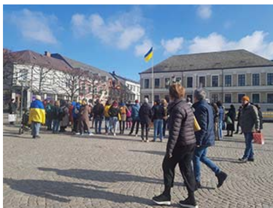
Lördag 12 mars kl. 15:00, Stortorget, Lund Manifestation för Ukraina.