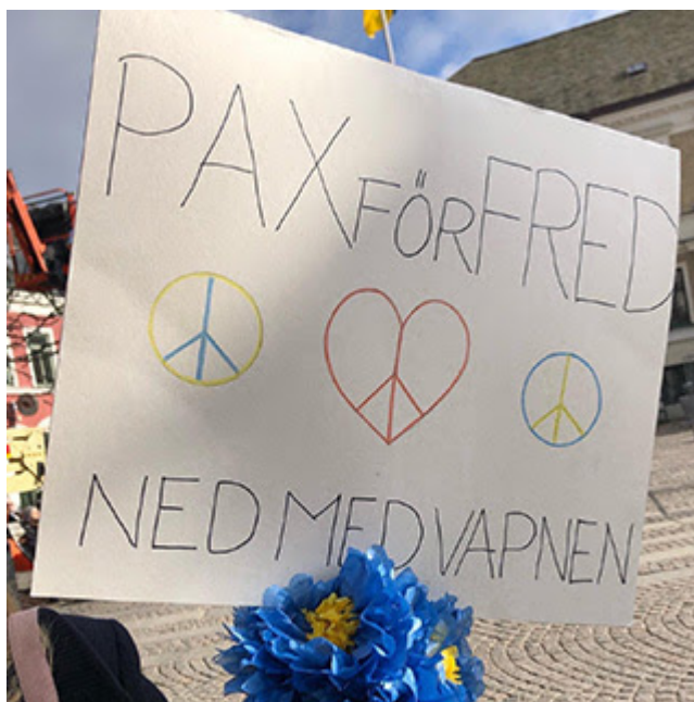
Söndag 6/3, IKFF och XR ordnar manifestation.

Manifestationerna mot det avskyvärda kriget i Ukraina har avlöst varandra under veckan. Minst tre har hållits på Stortorget och enligt uppgift hålls en ny på lördag 12/3.