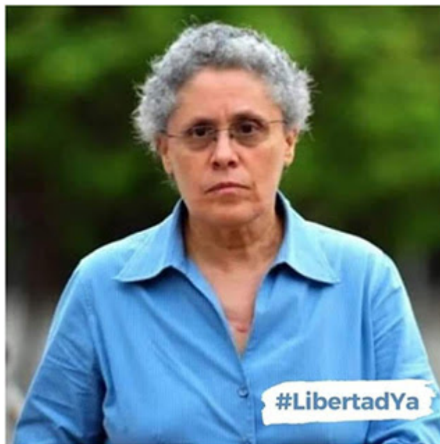
Dora María Téllez , revolutionshjälte, sitter i isoleringscell sedan 13 juni 2021. Hon greps på order av president Daniel Ortega.