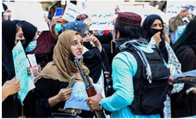
A protest in Kabul, 7 September 2021. 'No one knows if Taliban 2.0 will be a return to the 1990s or something more moderate. They may possibly not even know themselves.'

In a London Guardian (10 Sept) article headlined "The lesson of 9/11: we should have talked to our enemies", Powell says "the principal failure in Afghanistan was to fail to learn, from our previous struggles with terrorism, that you only get to a lasting peace when you have an inclusive negotiation - not when you try to impose a settlement by force. In Northern Ireland we tried making peace at Sunningdale in 1973, in the Anglo-Irish agreement in 1985, and in the Downing Street Declaration in 1993 - each time excluding Sinn Fein, and each time we failed to end the Troubles. Having tried everything else, we finally had to talk to the men with guns, and that is why the Good Friday agreement succeeded." http://bit.ly/Moz-Af-Powell