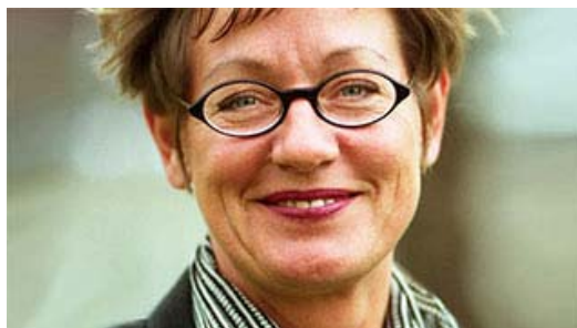
Gudrun Schyman 1996.