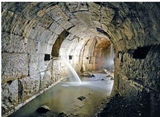
Cloaka Maxima i Rom

Från det planerade pumphuset vid järnvägsbron över Höje å ska en elva kilometer lång kloaktunnel grävas under Flackarps åkrar och Alnarpsparkens lummiga ekar till Sjölunda reningsverk i Malmö. Det kommer att ta tid; tunneln beräknas bli klar först 2032.