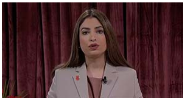
Nooshi höll ett inspelat tal som finns här :

Sedan senast har det såklart först och främst varit första maj! För andra året i rad har vi varit tvungna att fira ett digitalt första maj, på grund av pandemin och smittspridningen. Det är såklart inte lika roligt som att demonstrera på gator och torg, men vi når iallafall ut med inspelade tal. Att fira första maj digitalt är såklart ett avbräck, många av våra medlemmar och sympatisörer har första maj som sin enda, eller en av få, politiska aktiviteter under året och vi vet att vi vanligtvis värvar många medlemmar på första maj.