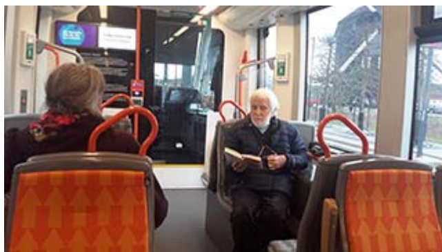
Artikelförfattaren åker spårvagn

I motsats till många svenska städer verkar Lund aldrig ha haft spårvagnar. Tills nu, 2020, när spårvagnen till ESS börjat rulla.