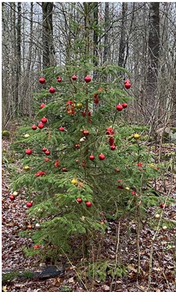
Lundajulgran i Skrylle