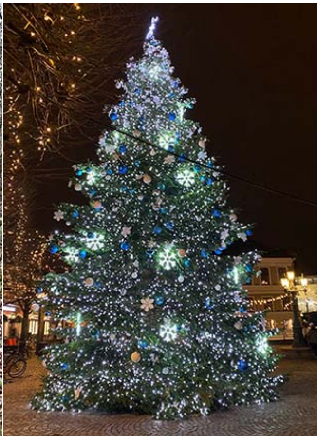
Lundajulgran på Stortorget

Så är vi framme vid årets sista nummer! Dags att tacka alla skribenter och läsare för att ännu en årgång VB har producerats och komsumerats.