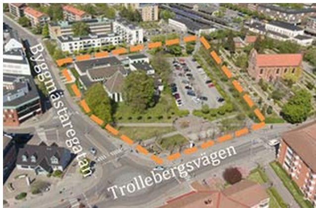
Drönbild över stadsbilden sett från söder, planområdet är markerat med orange linje.

Nu går startskottet för nästa stora strid mellan byggnadsnämndens majoritet och den stadsmiljömedvetna delen av Lunds befolkning. Medan striden om Galten pågår för fullt inleds den om Häradsövdingen.