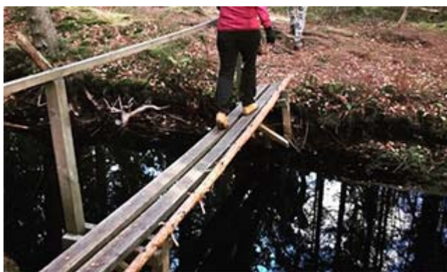
Enkel och billig bro, kan Lund ha råd med två?