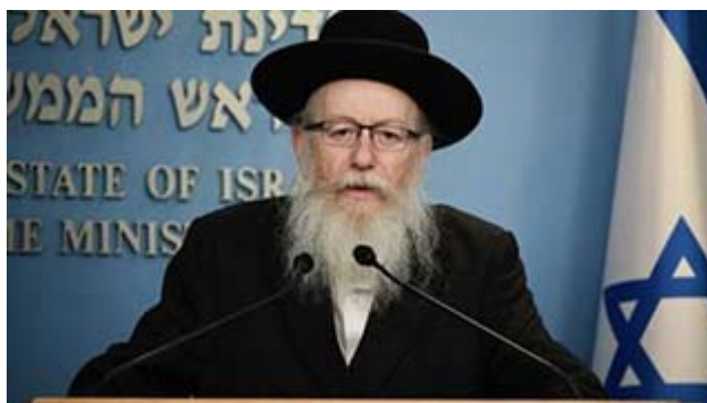
Israels hälsominister Yaakov Litzman, ledare för det ultraortodoxa partiet Förenade Torah.

Som bekant förutspår ju USA:s president Trump att coronavirusets spridning ska upphöra och de restriktioner som införts ska upphöra inom kort och att butiker och arbetsplatser ska öppna igen lagom till påsk. Trump ser ljuset i tunneln. Om detta ljus kommer från högre makt framgår inte av Trumps uttalanden.