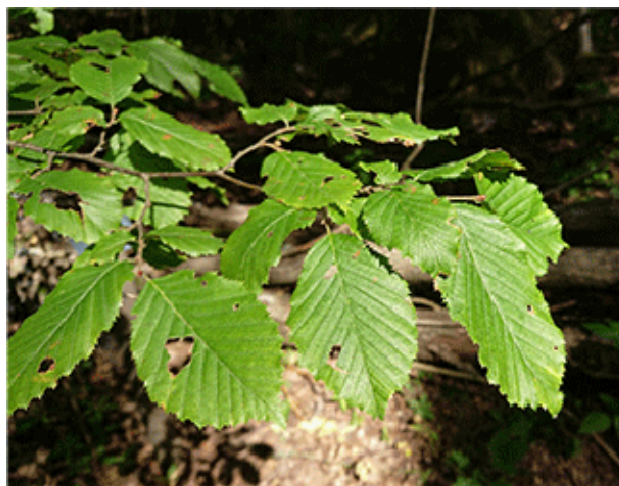
Avenbok - Carpinus betulus

skuttar mellan gungande kvistar. Årets första maskrosor lyser i en solglänta.