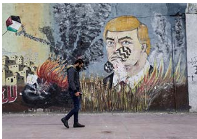
Graffiti in Gaza shows what Palestinians have come to think of US President Donald Trump's peacemaking.

Den som vill ta del av hela planen hittar den här på Vita Husets sida.