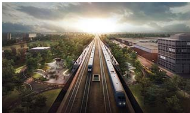
En nästan religiös framtidsvision av en station

De bör också ge upp planerna på utbyggnaden av Åkerlunds och Rausings väg till väg 108!