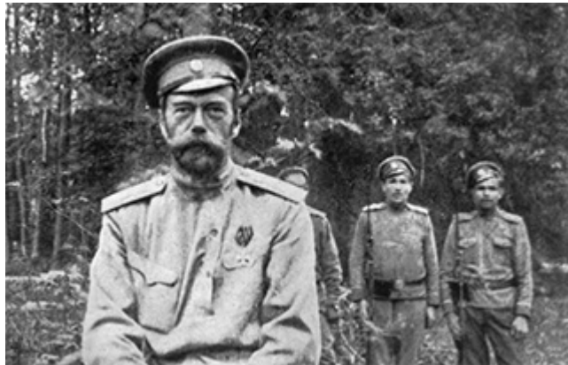
Tsar Nikolaj II efter abdikationen

1918, ett år efter maktövertagandet, skadades han svårt då en socialistrevolutionär som hette Fanni Kaplan sköt honom med tre revolverkott.