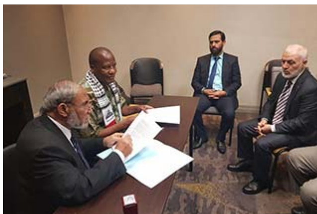
Hamas politician, Mahmoud al-Zahar (L), signs a Memorandum of Understanding with Jackson Mthembu of the ANC Parliamentary Caucus in Johannesburg, South Africa

I Sydafrika är det lätt att sjunga. Så verkar ha skett när ett viktigt dokument mellan palestinska Hamas och ANC undertecknades, se utdraget nedan.