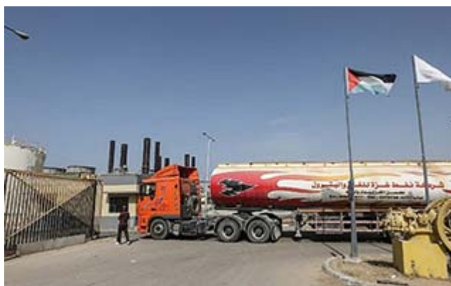
A tanker delivers fuel to the Nuseirat power plant in the Gaza Strip on October 24, 2018.

The deal emerged amid ongoing indirect negotiations between terror group Hamas, which rules the Strip, and Israel, mediated by the UN and Egypt, in hopes of reaching a long-term truce.