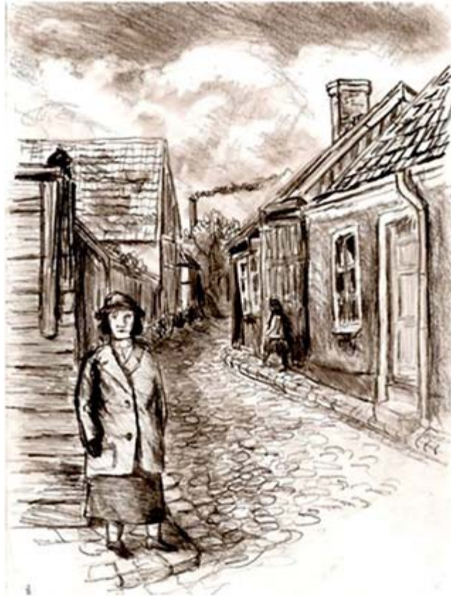
Nöden i Lund, teckning av Axel Nelson.

I dag är mitt flöde fullt av kvinnor. Och då tänker jag på de kvinnor jag för några år sedan gjorde ett forskningsarbete om, kvinnor som arbetade i olika industrier i Lund kring förra sekelskiftet. På de ca 30 kvinnor vars liv jag spårade genom kyrkböckerna, hur ytterst sköra deras liv var, hur nära fattigdom och misär de levde, och hur flera av dem föll över den kanten. Alla barnen de födde, inom- och utomäktenskapliga, en del dog, en del måste lämnas bort, till fattiggården, barnhem eller utackorderas. Hur utan fast punkt de levde, flytt från ort till ort, adress till adress, arbete till arbete. Bristen på lantbruksarbete var akut, unga människor från landsbygden strömmade in till städerna och arbetstillfällena i fabriker där. Men en ung pojke kunde börja som lärling och arbeta sig upp till yrkesarbetare. Den möjligheten hade inte de unga flickorna. De var fast i lågt betalda rutinarbeten livet ut.