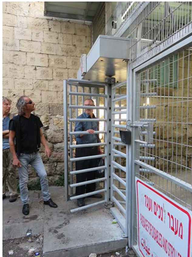
Hebrons tidigare huvudgata ligger nästan öde. Palestinier bor i en del av husens markplan, medan israeliska ockupanter bosatt sig i ovanvåningar. Bara de få palestinier som bor längs gatan får passera, och då genom en städse stängd svänggrind. Omedelbart innanför grinden finns en militärpostering, där palestinerna identitet kontrolleras och noggrann kroppsvisitering sker. Ibland hålls grinden stängd i flera timmar - ingen kan passera.