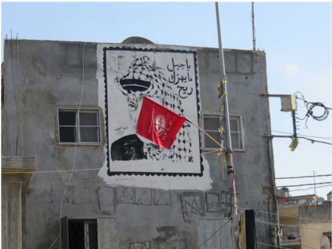
PLFP:s flagga skymmer delvis väggmålningen av Abu Ammar - Yassir Arafat - på väggmålning i Hebron.