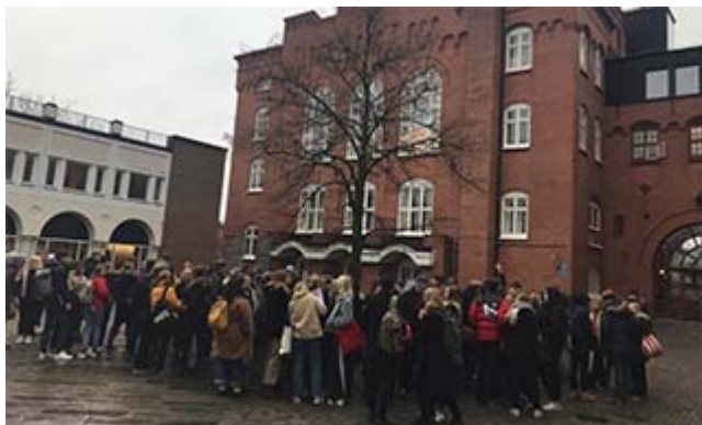
Demonstration på Spyken i Lund

Elever i Polhemsskolan och Spyken strejkade den 12 december i protest mot utvisningarna av ensamkommande. Initiativ till strejken hade tagits av föreningen Ung i Sverige. 28 skolor i Stockholm deltog liksom minst 13 andra städer. De har hittills SD, KD, L och M emot sig. C har inte bestämt sig.