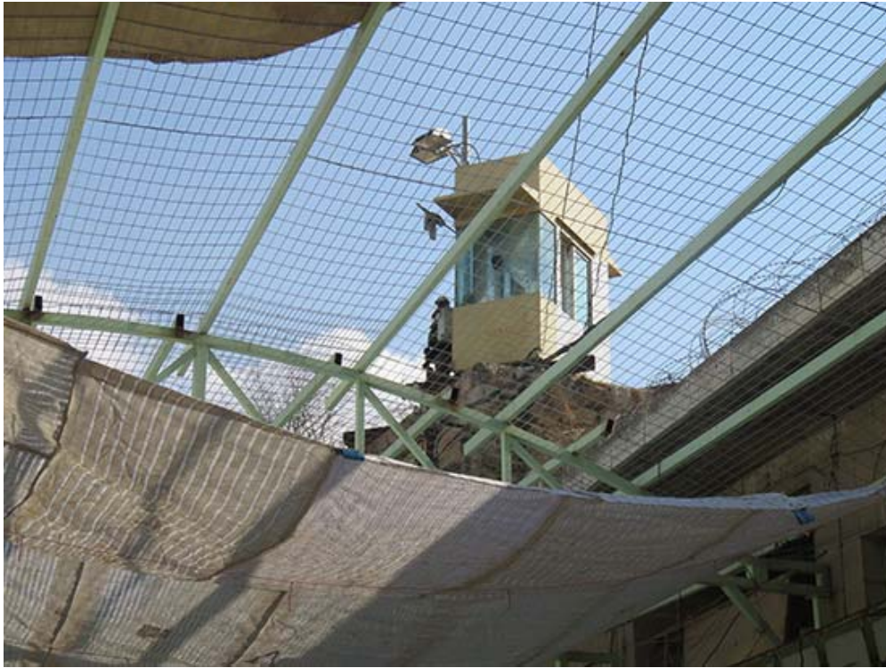
Gata i gamla stan i Hebron. Palestinier på markplan och olagliga israeliska ockupanter i våningen däröver. Nätet och tygstycket är till för att förhindra att avfall och andra mänskliga restprodukter slängs av israelerna ner på de palestinska invånarna - något som frekvent förekommit innan skyddsanordningarna sattes upp. Notera militärposteringen på taket.