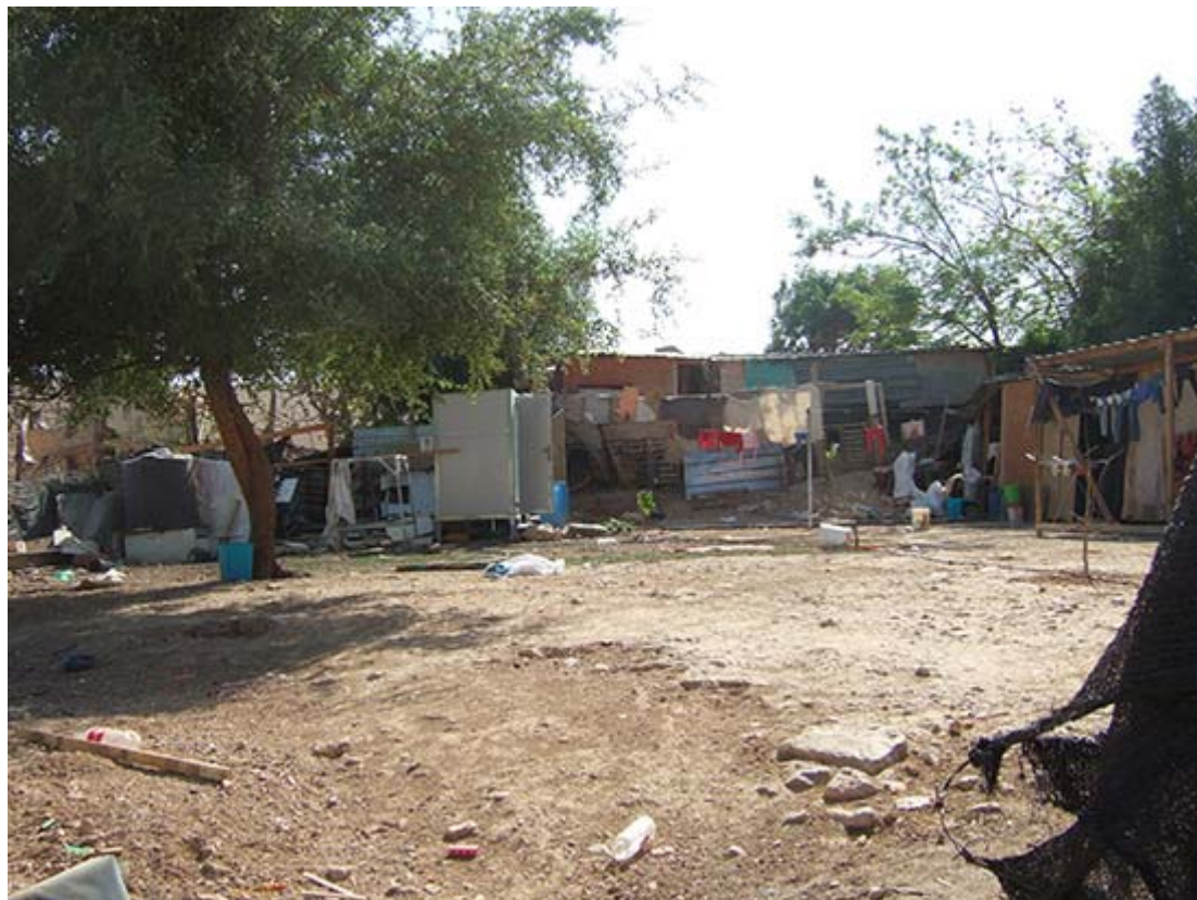
"Bosättning". Från sina traditionella betesmarker av Israel fördrivna beduiner.