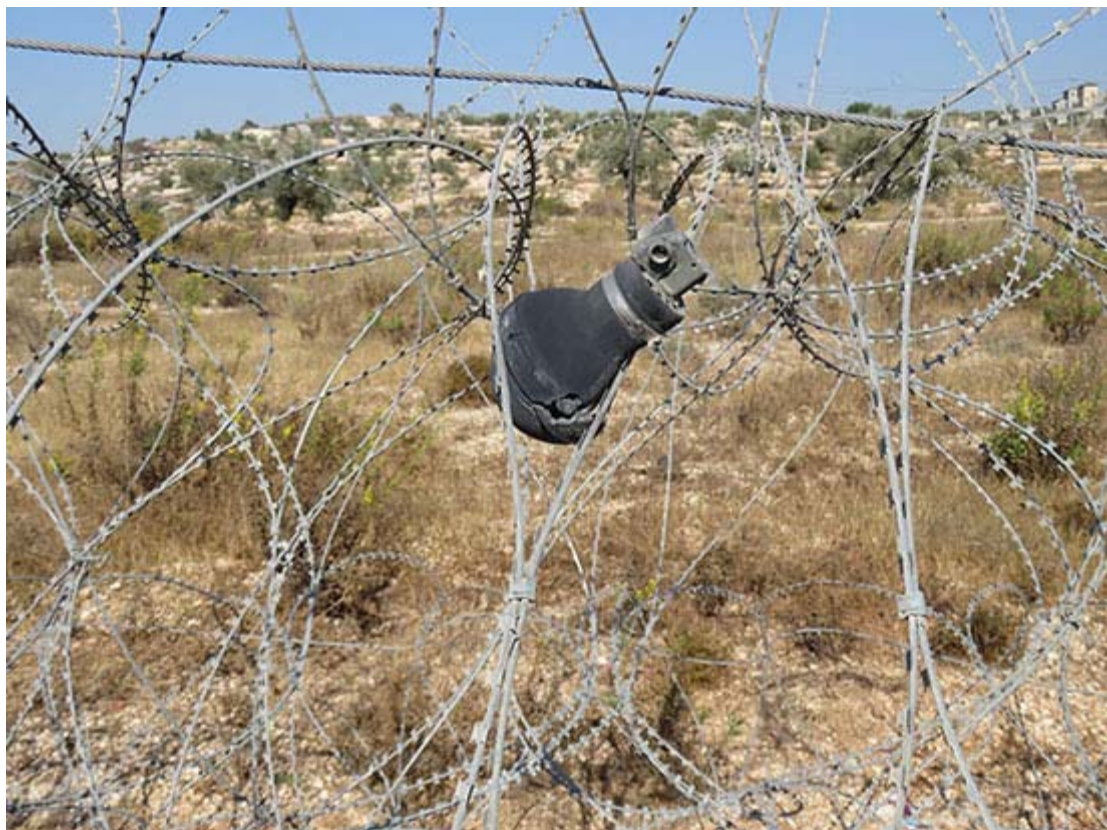
Rakbladstaggråd utanför en ockupantkoloni vid Bilin.

Den israeliska rakbladstaggrådsindustrin är en blomstrande bransch - taggråden är också praktiskt taget allstädes närvarande.