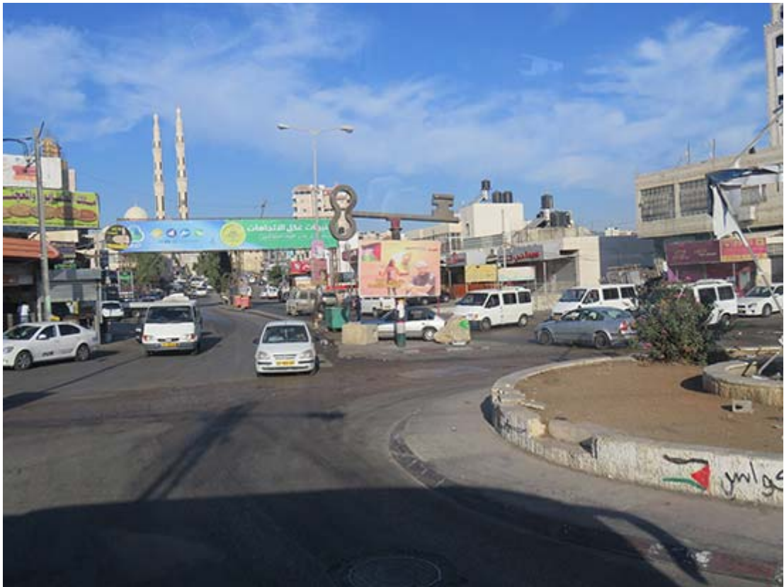
Nyckeln - sinnebilden för de drygt 5 miljoner flyktingarnas strävan att få återvända. Många flyktingar har kvar nyckeln till det hem som de, deras föräldrar och tidigare generationer tvingats lämna.