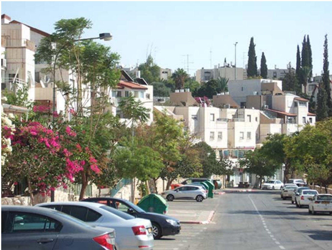
"Bosättning". Israeliska kolonister på ockuperad mark.

Tänkte detta kunde avsluta min rapportering från resan, men däremot absolut inte från att skriva om Palestina.