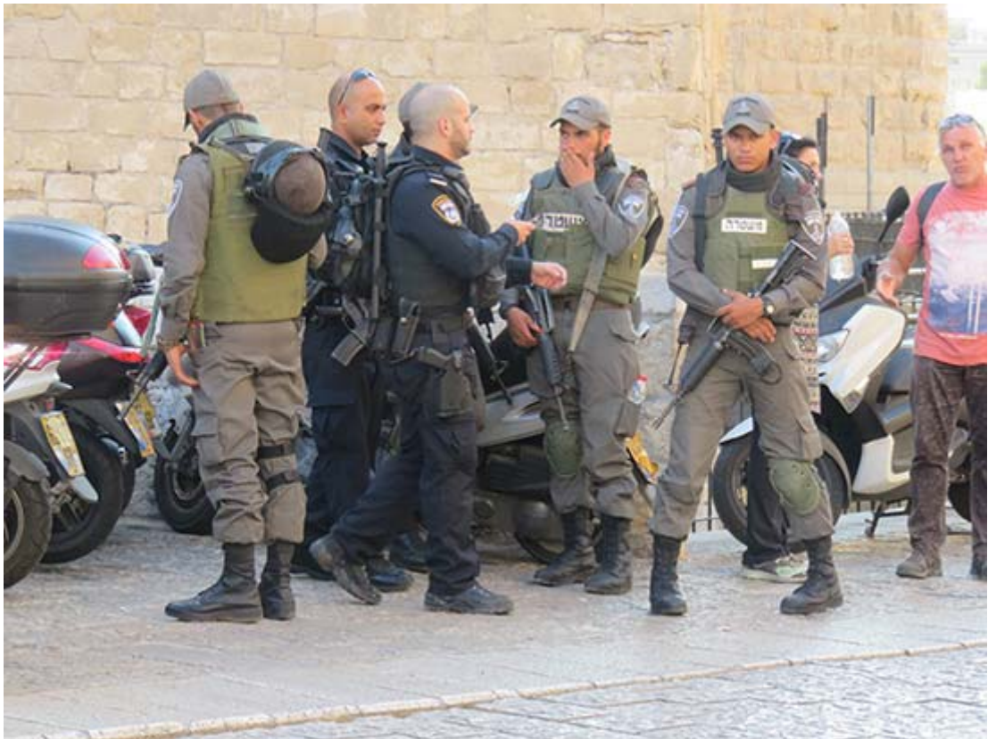
Den allestädes närvarande ockupationsmakten. Här i al-Quds/Jerusalem.