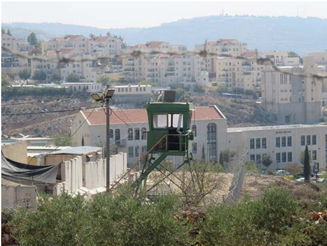
Den närbelägna israeliska kolonin som skyddas av militärens övervakning.