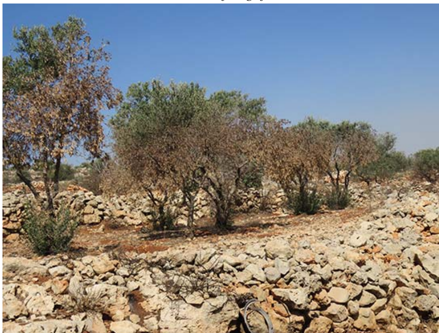
Delar av den brända olivodlingen.