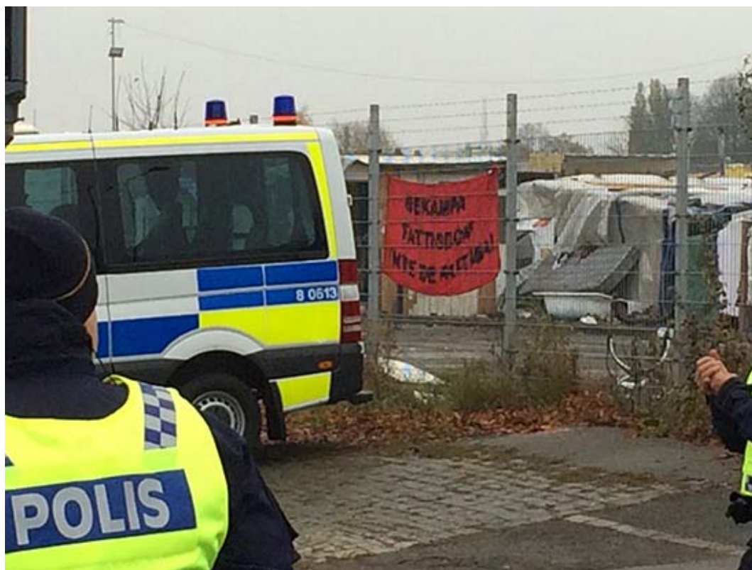
Bekämpa fattigdom inte de fattiga