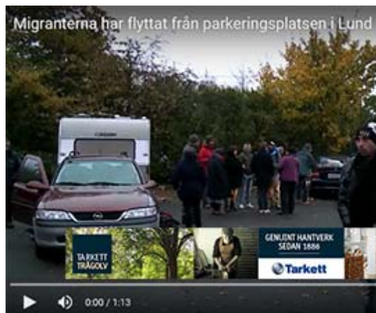
Bild från Sydsvenskans film från avhysningen.

Reklamen om ett äkta trägolv från Tarkett, som man får på köpet antingen man vill eller ej, är nästan för håfull för att vara sann.