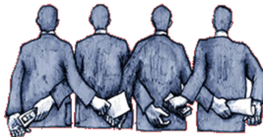
En artikel från från tidningen