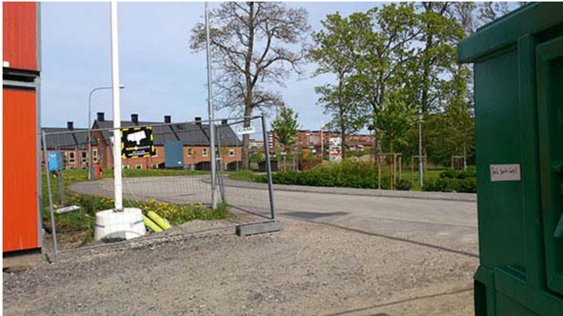
Åbrinksvägen är infart till Källby ängar från Sankt Lars. Höghusen på Klostergården syns i bakgrunden.