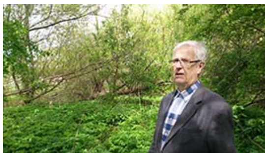
Artikelförfattaren i vildmarken vid ån

Foto: Per Roijer. Se fler bilder från deras vandring i ålandskaper vid S:t Lars.