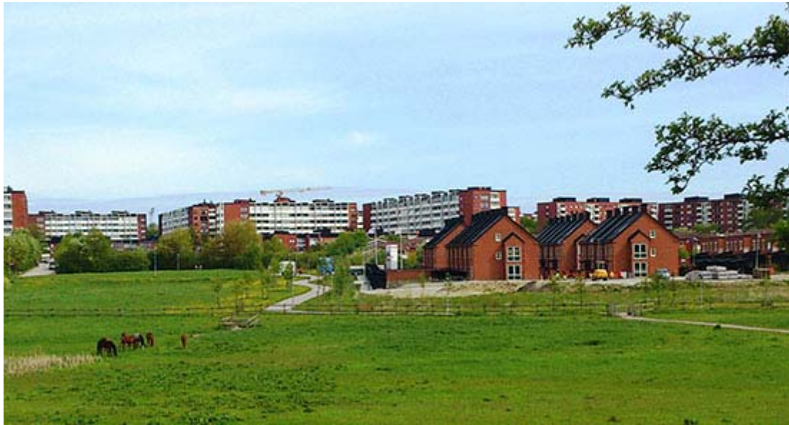
Utsikt från åsidan