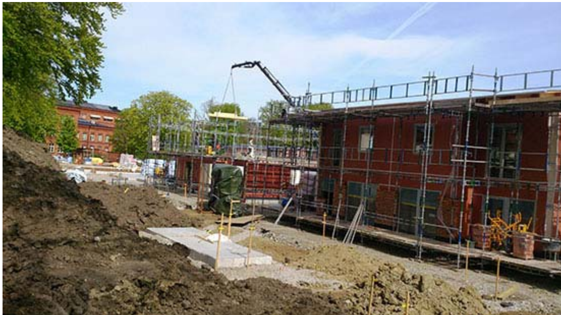
Västra Sankt Lars, Hunnerupsområdet. De äldre byggnaderna skymtar i fonden.