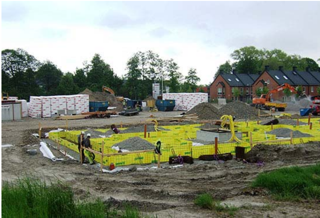
Blivande hyreshus vid Källby ängar