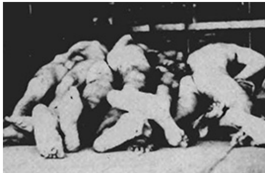
64. Corpses of victims of the Deir Yassin massacre.

Den 9 april är inte bara årsdagen av den tyska ockupationen av Danmark och Norge 1940. Det är också årsdagen av en västvärlden glömd och nedtystad händelse år 1948 – massakern på befolkningen i den lilla palestinska byn Deir Yassin.