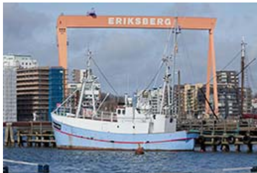
Marianne av Göteborg ska bryta blockaden

Idag onsdag 8 april kan Ship to Gaza Sverige tillsammans med Ship to Gaza Norge tillkännage köpet av Marianne av Göteborg* , en trålare på 85 bruttoton, som kommer att användas vid sommarens aktion för att bryta den illegala och inhumana blockaden av Gazaremsan.