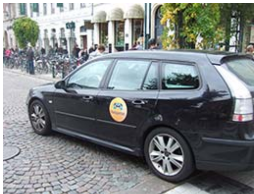
Folkpartibilist skapar egna regler vid Stortorget dagen före valet

I valrörelsen gick Folkpartiet ut med att man ville tidigarelägga beslut om förbud mot biltrafik på Bangatan. Gott så. Fast man kan ju redan nu på direkten ta beslut om att förbjuda Folkpartiets egna bilar att färdas där det är förbjudet.