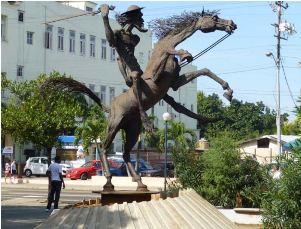
Don Quijote är mycket populär på Kuba

Den tredje och sista artikeln från besöket i Kuba, januari 2013