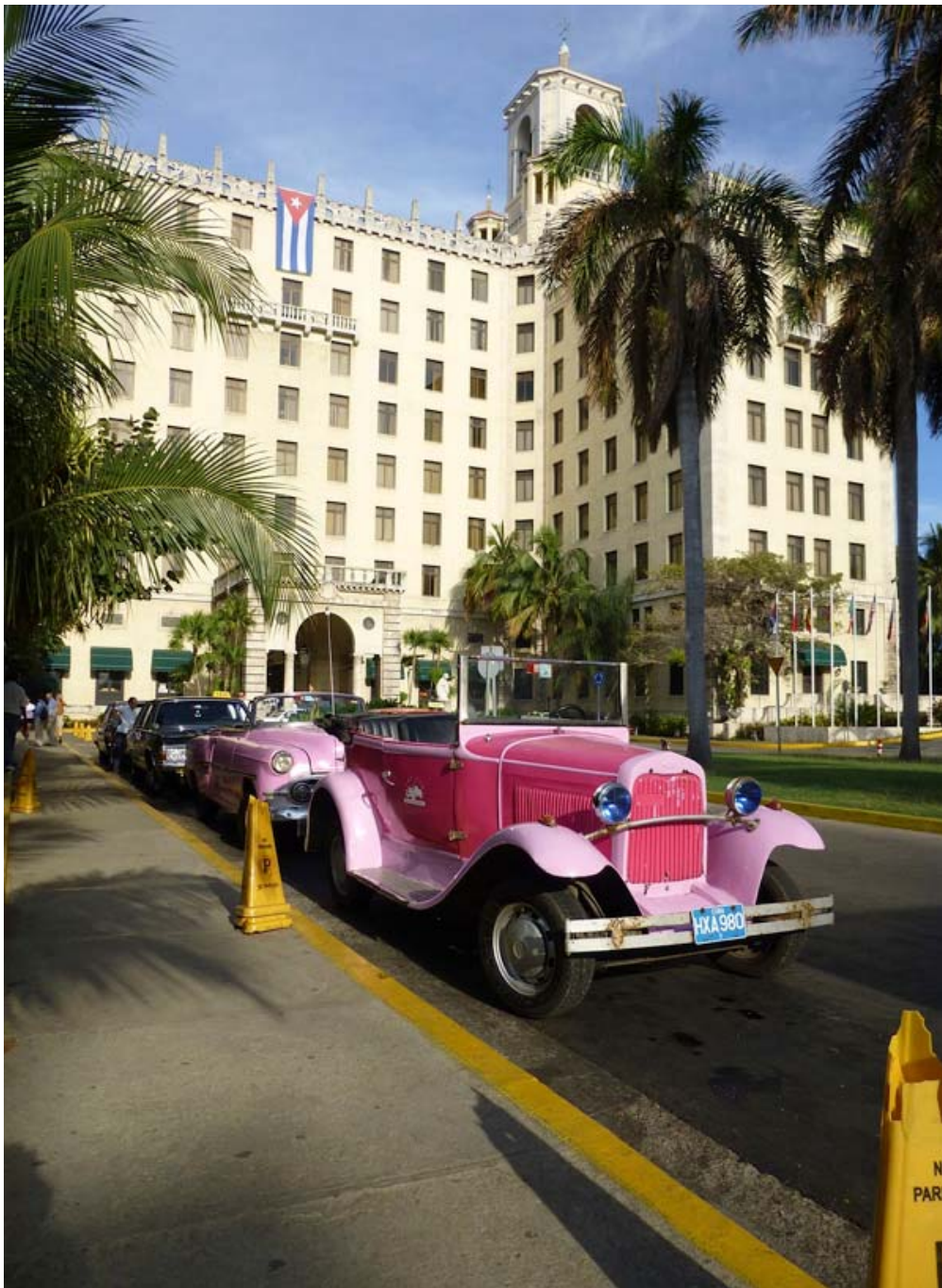
F.d. maffians bilar idag framför dess f.d. högborg