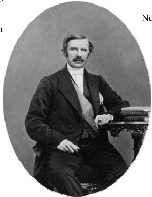
Johan August Gripenstedt