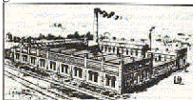
Armaturfabriken 1894. Okänd tecknare.