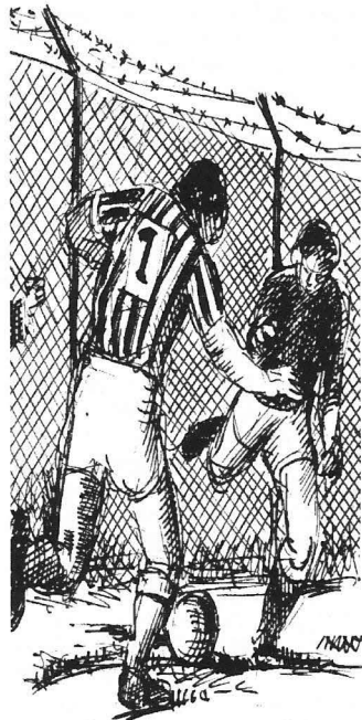
Lunds domkyrka kab kanske mäta sej med Notre Dame men när det gäller Stade de France hmnar vi ohjälpligt efter.

Det finns väldigt många lokala arbetarrörelseorganisationer i världen. Dessa är inte lika lätt att observera från luften. Många människor ägnar sig där åt politisk och facklig kamp för arbetsrätt, mot hunger och utsugning, för internationell solidaritet, för välfärdssystem med mera, med mera. Ett av de många symbolnamn som brukar användas i det här sammanhanget är Marx . Eftersom arbetarrörelsens värderingar har stort genomslag kan dessa naturligtvis användas av såväl krafter som vi anser vara goda som sådana som vi anser vara onda. Men det är ingen tvekan om att arbetarrörelsens ansträngningar har haft många påtagligt materiella effekter.