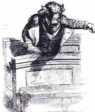
Skall Du rösta på Cicero?

Hur Piso reagerade på dessa verbala uppkastningar, vet vi inte. Men det finns åtminstone ingenting som tyder på att hans svärson Caesar blivit mindre vänligt stämd mot Cicero för de-