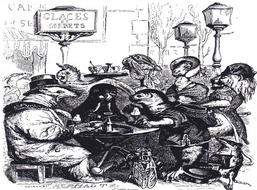
Sakkunniga sammanträder, ämne: "en vandrande katastrof"