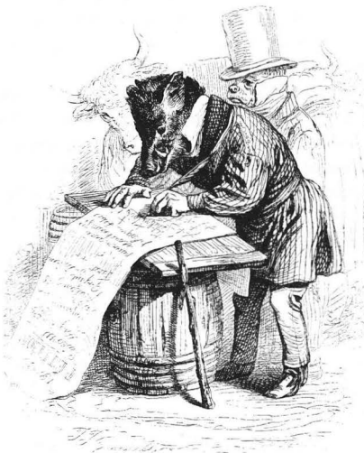
Några IB-agenter i arbete med registreringen.