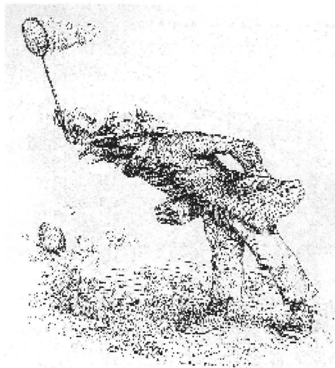
En VB-reporter på fältet

penslat med smält smör och till det en halv liter svagt kaffe. Det var helt enkelt mat för skogshuggare. Jag träffade på ett vänsterbokcafé där man i fönstret annonserade årets förstamajmöte tillsammans med ett par kängor och ett anslag om att man sålde, med ett för mig nytt uttryck, vegetariska skor. Den amerikanska vänstern verkade alltså sig lik. Sen gick jag till Centralstationen som hade ett klocktorn som till förväxling liknade det på Malmö C. Men platserna på tåget till Seattle var slut så jag fick ta bussen igen.