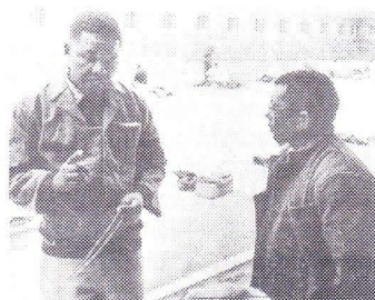
Nelson Mandela (t.v.) och Walter Sisulu på Robben Island 1966

Guiderna på Robben Island är mycket professionella. I stället för att skapa en atmosfär av olycka, elände och