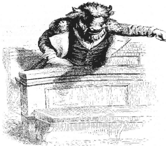
201. The bison speaks out at a meeting of the rebels.

Redan på 70-talet började den basen krackelera - varvskrisen, textilindustrins utflyttning och det meningslösa akutstödet till diverse dödsdomda industrier på bruksorter är exempel på det. Idag står det klart för alla att vi inte kan förlita oss på storföretagen. Det behövs