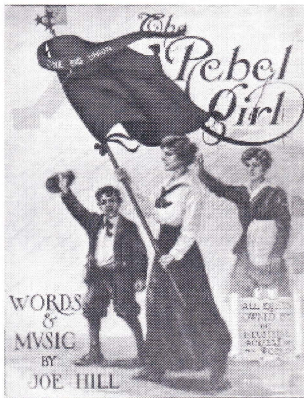
Joe Hill, den svenskfödde agitatorn och visdiktaren, verkade inom IWW, den syndikalistiska grenen av den amerikanska arbetarrörelsen.