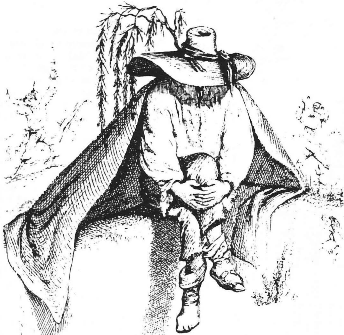
"Vänsterns fotfolk verkar för ögonblicket inte särskilt energiska eller engagerade i att motverka den påtagliga faran från extremhöger."