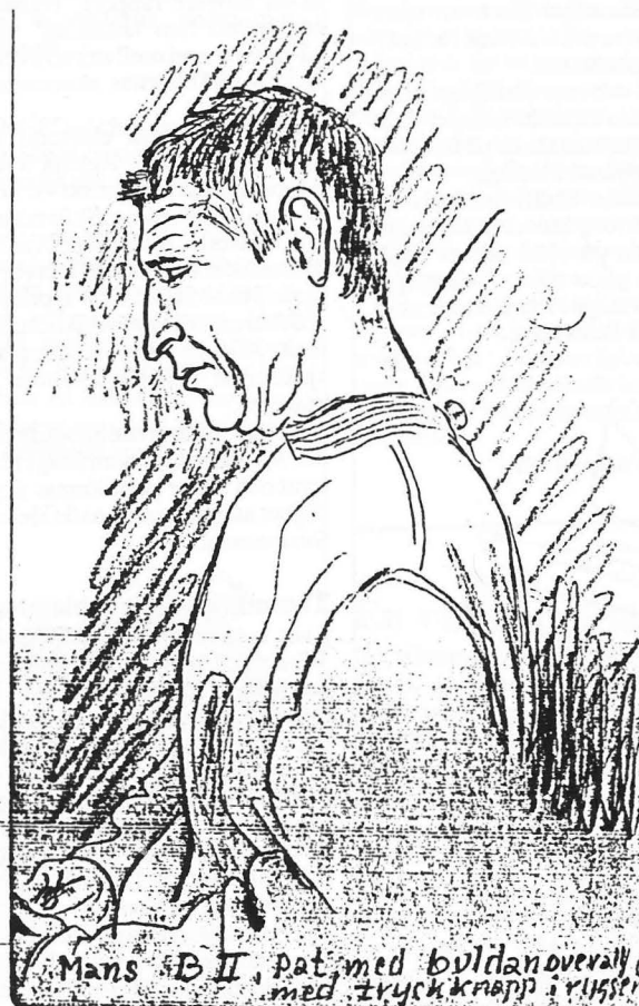
Så sent som en bit in på 50-talet var oroliga patienter utrustade med kläder som ej gick att riva sönder, plus tryckknapp i ryggen som endast skötarna kunde låsa upp med nyckel. Teckning Göte Bergström.

det handlar om samma ställe. I Sinnessjuk i Folkhemmet fasthålls hela tiden perspektivet underifrån. Det är en bok man blir berörd av, för här kartläggs ytterligare en liten del av de undanskuffades historia. Den som sällan syns i de vanliga historieböckerna.