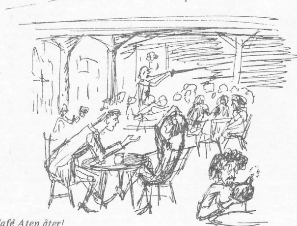
Café Aten åter!

Efter denna rikspolitiska utflykt, unik i denna krönikas historia, låt oss behandla mer närliggande ämnen, t ex härvarande högskolenheten. Den vetenskapliga diskussionen där handlar sedan något år i första hand om löner. Det är klart det är viktigt vilken lön man har och jag har aldrig förstått varför t ex framstående forskare och lärare ska betalas sämre än såg reklamassistenter eller skattekonstuler. Lite sämre betalt kan man acceptera med tanke på all den dyra whisky de senare tvingas konsumera för att kunna stå ut med vad de sysslar med - vi på universitetet klarar oss ju med de enkla sorterna. Men lönesnacket står mig faktiskt upp i halsen