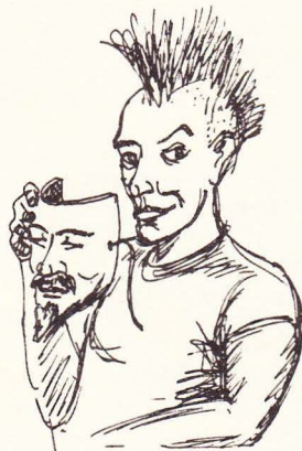
KHF håller på att förnya sin politiska verksamhet och lösgöra sig från leninismens och de andra dogmernas förkvävande grepp.