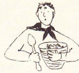
KOKSFILOSOFENS REVOLUTIONERANDE RECEPT