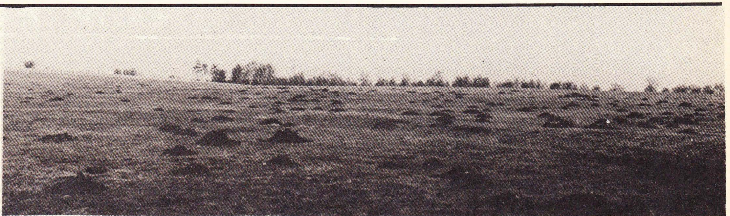
Kamrat Mullvad har slagit till igen. Ovanstående syn kunde den som vandrade förbi Kungsmarkens golfbana i söndags glädjas åt. Hela golfbanan var ännu inte lika upparbetad, men vi håller tummarna för våra underjordiska vänner. Litet handfast utomparlamentariskt arbete kan allt behövas i dessa yttersta tider när Axel Danielssons skapelse Arbetet börjat med golfspalt.

Alla är välkomna - inträdet är fritt! (Pengar kommer dock att samlas in för att stödja kvinnorna som demonstrerar vid kärnvapenbasen Greenham Common i England, samt för att täcka utgifterna för seminariet).