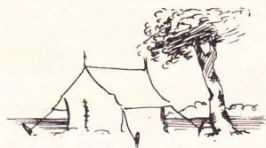
Även i år genomförs VPK Skånes sommarläger i Lönsboda.

skott (liksom tidigare). Inför 1982 års försvarspolitiska beslut kommer diskussionen kring försvars- och säkerhetsfrågorna upp till ytan. Kampen för Norden som kärnvapenfri zon måste drivas vidare (Kristian IVs emblem verkade stödja detta, det satt omedelbart ovanför en fredsbanderoll).