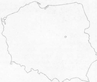
Noch nicht (noch einmal) verloren.

Sovjetunionen är inte en imperialistisk stat, men dess utrikespolitik har imperialistiska förtecken. De sovjetiska stormaktsintressena hotar idag eller kränker helt öppet den nationella självbestämmanderätten i Polen, Eritrea och Afghanistan.