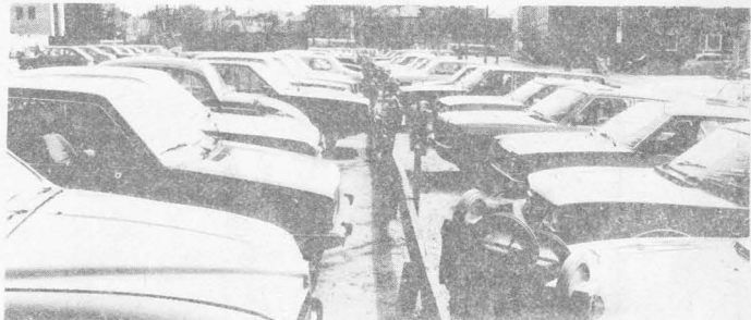
Inte ovanlig lundensisk stadsmiljö.

Vägar man sig på en bedömning av läget i halvtid i Lund så pekar det nog åt ett regimskifte nästa år. Fortsätter borgarna som nu, med vilda rallarsvingar åt alla håll och utan sakdiskussion så är utgången given. Då kommer inte ens