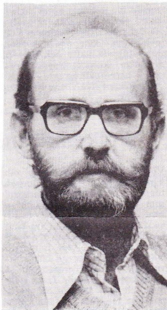
Lund ett vaket och medvetet släkte, som inte tillåter något som helst »väld». Demokratien är VPK:s särmärke.

Uppgiften för en förtroendeman eller ombudsman måste vara att fullgöra de olika saker skilda instanser i en organisation ålägger honom eller henne. Man kan sägas vara »springgrabb» för medlemmarna och inte en som utnyttjar sin position för att tillskansa sig makt. Ombudet ska i möjligaste mån avlasta överbelastade partiarbetare. Att ombudet genom sitt läge eventuellt kan skaffa sig vidare utblick och bättre insikter får inte användas i privat politiskt syfte utan måste komma hela organisationen till godo. För övrigt är VPK:arna i